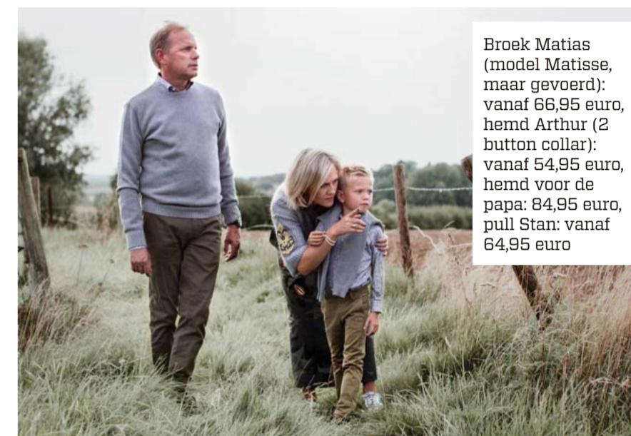
Broek Matias (model Matisse, maar gevoerd): vanaf 66,95 euro, hemd Arthur (2 button collar): vanaf 54,95 euro, hemd voor de papa: 84,95 euro, pull Stan: vanaf 64,95 euro

S hoppen met een jongen loopt niet van een leien dakje. Na twee minuten ligt die te rollen in de etalage, ben je hem kwijt of heeft hij geen zin meer om te passen. Om gek van te worden.”