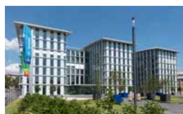
Beeld van het BASF kantoorgebouw in het Duitse Ludwigshafen

Zo kan men klanten, planners en architecten steunen via consultatie en toegang tot de gehele chemische portfolio van BASF voor de bouwwereld. Met meer dan 200 BIM (Building Information Modeling) voorwerpen en binnenkort ruim 400 Revit-modellen is de BASF BIM-portfolio de grootste in de chemische industrie gericht op de bouw. Ze overspant dertien industriële segmenten, zoals Waterproofing Systemen, Performante Vloeren, Betonreparatie of Beschermende Coatings, net zoals Uitzettingscontrole Systemen en Muursystemen. Deze digitale oplossingen zijn beschikbaar in meer dan tien talen. De komende jaren wil BASF zijn